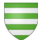
Ville de Soultz- ss-Forêts