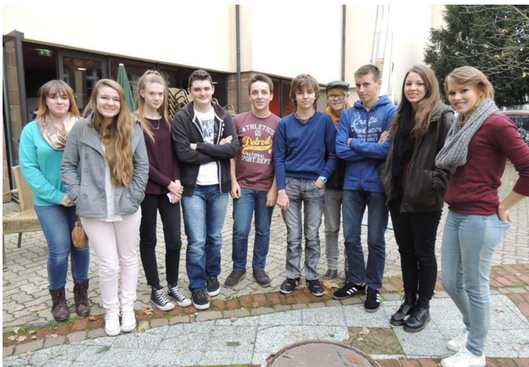
Le jury CAV juge le récit, la technique utilisée et les impressions suscitées par les films.

► (*) Le programme du jour des Rica figure en première page de ce cahier.